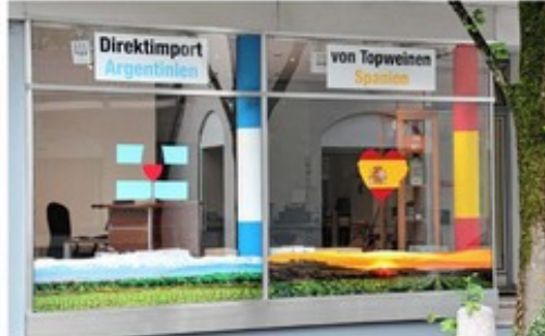
Neue Adresse für Weinliebhaber: Das Weinhaus Am Esbaum 7.